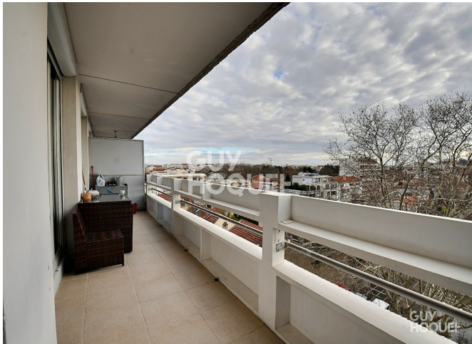
Photo du bien